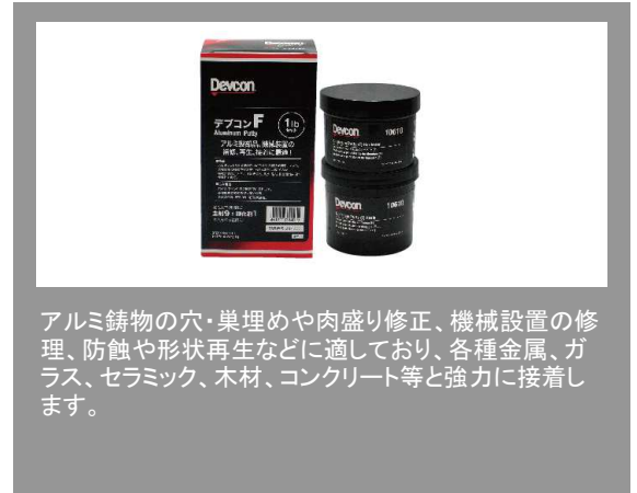
アルミ鋳物の穴・巣埋めや肉盛り修正、機械設置の修理、防蝕や形状再生などに適しており、各種金属、ガラス、セラミック、木材、コンクリート等と強力に接着します。